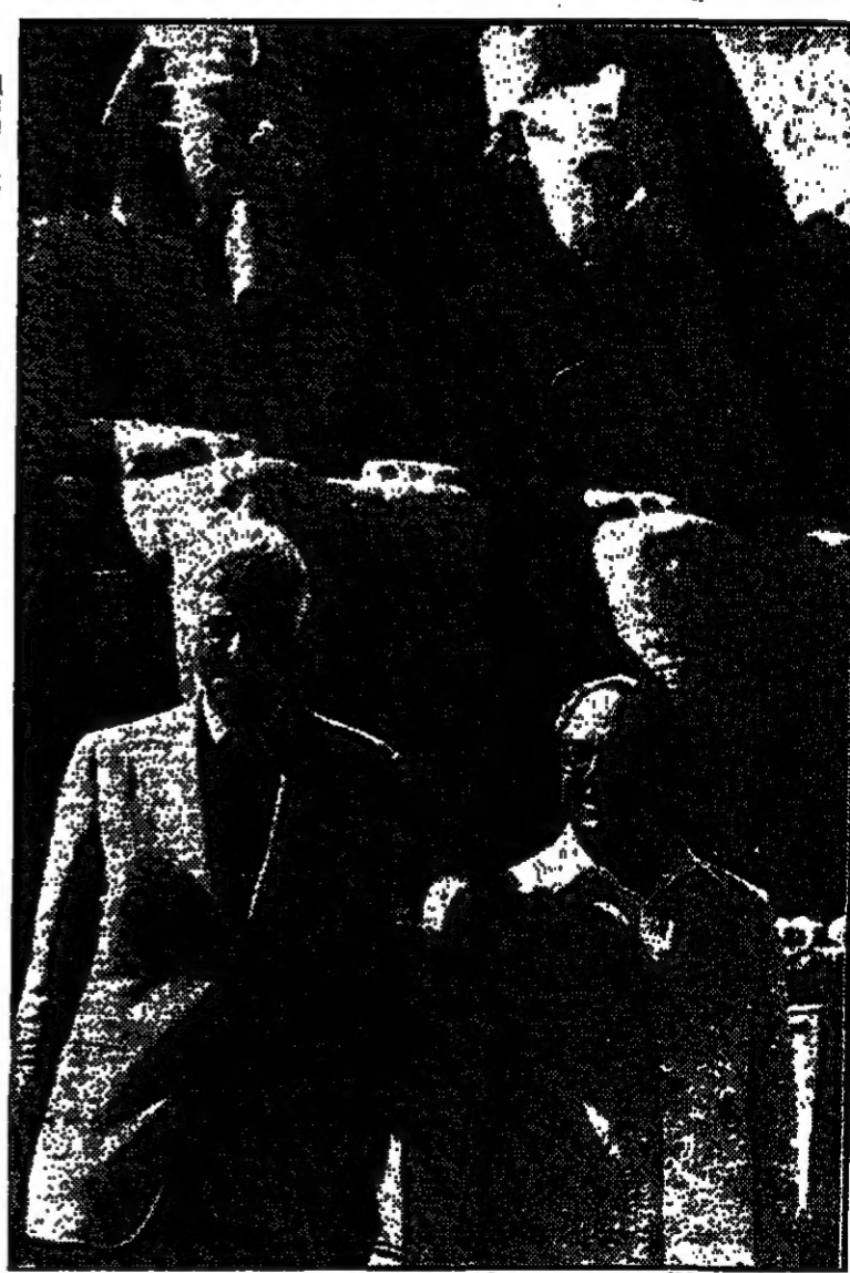
الرئيس ناسون مع وزير الصناعة المصري السيد طه زكي قسي معيد ابو سنبل .